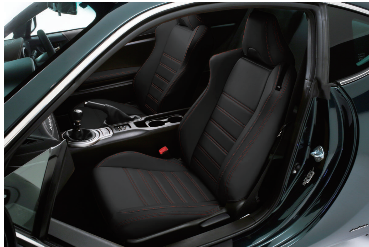
プレミアムフィットシートカバー ブラック×レッドステッチ・・・・・・・・¥38,000(税抜)