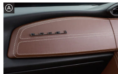
パッセンジャーパネル・・・¥28,000(税抜) ※エンブレム(ancel)は別売となります。