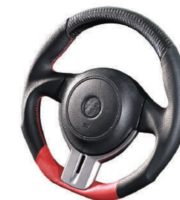
カーボン×FORMULA・・・¥58,000(税抜)

⚠ フレーム部分は車種専用設計をしておりますが、車両側の個体差によってステアリングが水平位置より回転方向に対して「最大5.5度」傾く場合がございます。このような場合は、車両側のタイロッドの調整により補正を行って下さい。また、その費用につきましては、お客様にてご負担下さいませお願い申し上げます。