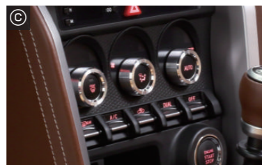
エアコンダイヤルリング・・・¥15,000(税抜)