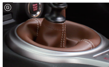
シフトブーツMT専用・・・¥18,000(税抜) シフトブーツAT専用・・・¥18,000(税抜)