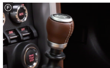
シフトノブMT専用・・・¥18,000(税抜) シフトノブAT専用・・・¥18,000(税抜)