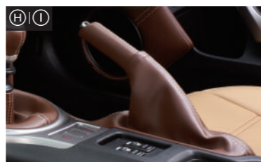
パーキングブレーキノブ・・・¥20,000(税抜) パーキングブレーキブーツ・・・¥32,000(税抜)