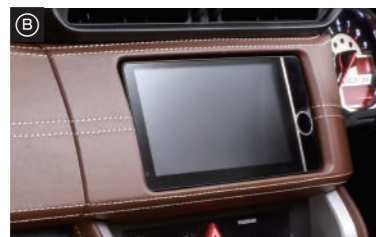
センターパネル・・・¥28,000(税抜)