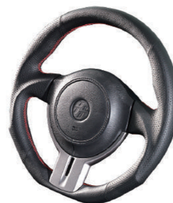
レッドステッチ・・・¥48,000(税抜)

※純正エアバッグ、スイッチ等をそのまま装着可能な小径スポーツステアリングです。ステアリングのみを交換可能。86/BRZ(ZN/ZC)専用、車検対応品。デモカー装着品はオリジナルステッチ(糸)となり、製品とは異なります。