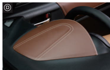
メーターフード・・・¥28,000(税抜)