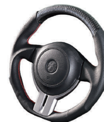
カーボン×レッドステッチ・・・¥58,000(税抜)