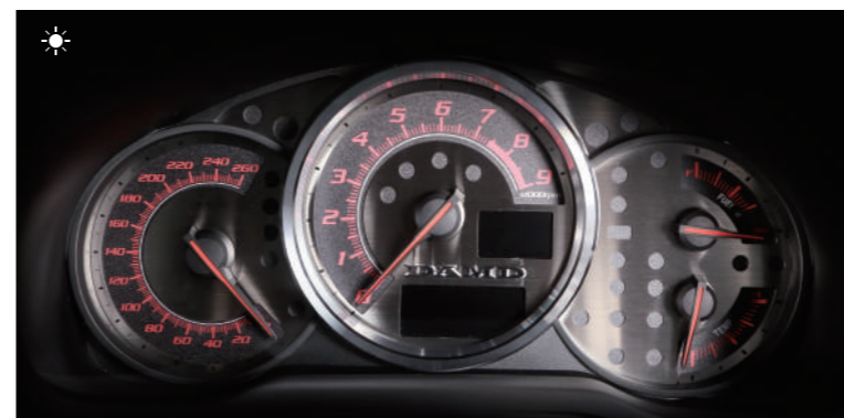
TYPE-SB スポーツブラック・・・¥48,000(税抜)