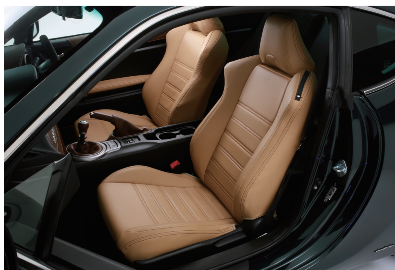
プレミアムフィットシートカバー タン×ブラウンステッチ・・・・・・・・¥38,000(税抜)

「こんな空間を作りたい」というイメージを元に、時間をかけて素材を探し「個性」「大人の空間」「上質」をデザインしました。