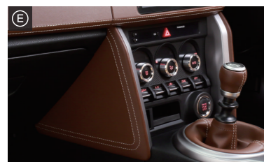
ニードッド RL・・・¥18,000(税抜)