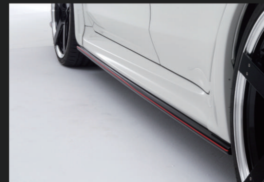
② サイドエクステンション(ABS製)

Ver.1 未塗装品素地……¥47,000 (税別) Ver.2 未塗装品素地……¥47,000 (税別) 別途塗装代……¥16,000 (税別) 別途塗装代……¥15,000 (税別)