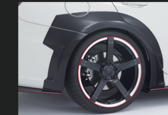
⑤ オーバーフェンダーパネルキット(ABS製) R

未塗装品素地……¥30,000 (税別) 別途塗装代……¥13,000 (税別)