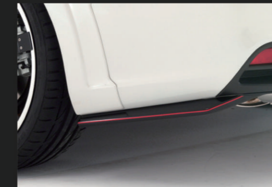
③ リアサイドエクステンション(ABS製)

未塗装品素地……¥49,000 (税別) 別途塗装代……¥16,000 (税別)