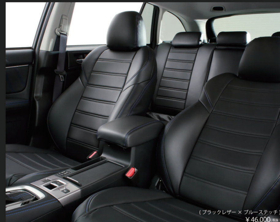
(ブラックレザー×ブルーステッチ) ¥46,000 (税別)

未塗装品素地……¥40,000 (税別) 別途塗装代……¥16,000 (税別)