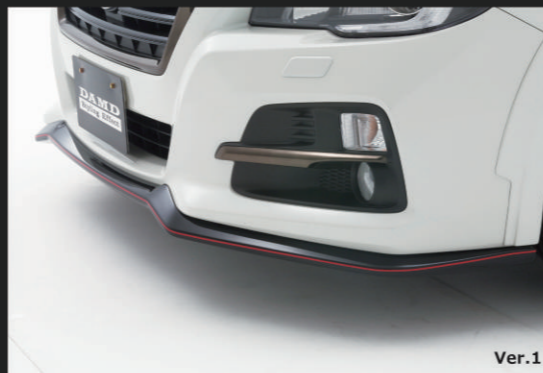
① フロントアンダースポイラー(ABS製) Ver.1

最新テクノロジーを駆使し、市街地での走破性も考慮したデザインを採用。先端部がフラットタイプのVer.2もご用意しております。