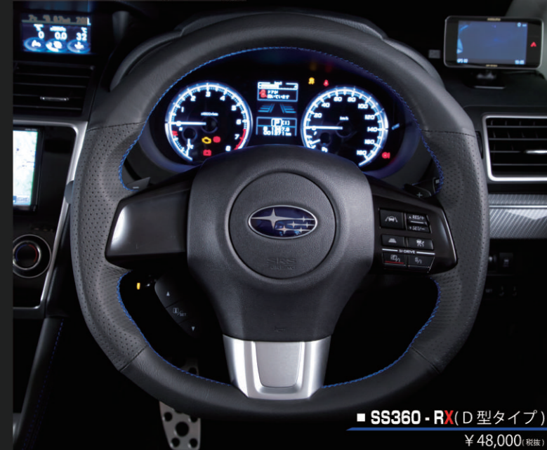
■ SS360-RX (D型タイプ) ¥48,000 (税別)