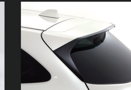
⑥ ルーフスポイラーエクステンション(FRP製)

純正ルーフスポイラーの後端部を延長することにより、リアサイド部の空気の流れを整え、無駄な巻き込みを防ぎます。