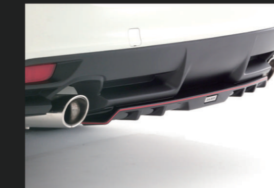
④ リアアンダーガーニッシュ(ABS製)

未塗装品素地……¥34,000 (税別) 別途塗装代……¥17,000 (税別)