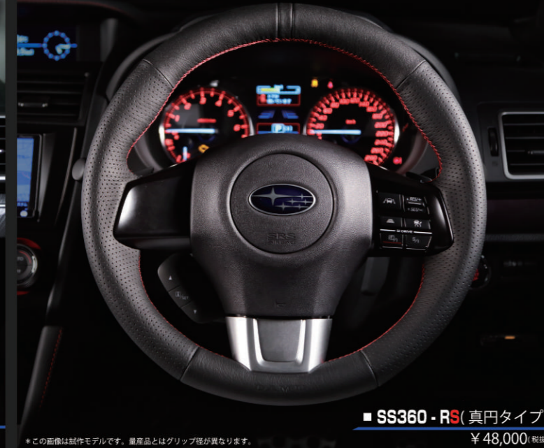
■ SS360-RS (真円タイプ) ¥48,000 (税別)