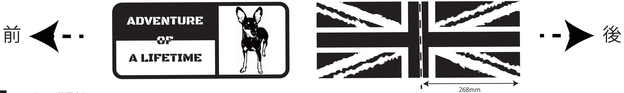
図2 ステッカーの位置出し 左右で同じように位置を出し、マスキングテープ等でラインをひきます。