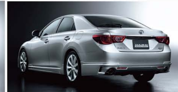
モアスポーティーかつ、モアグレッシブに彩るメリハリのあるプレスラインと、ダクトの攻勢