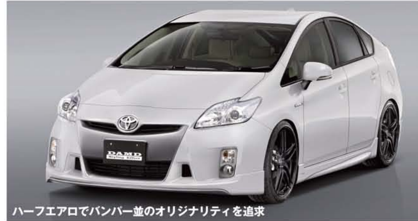
ハーフエアロでバンパー並のオリジナリティを追求