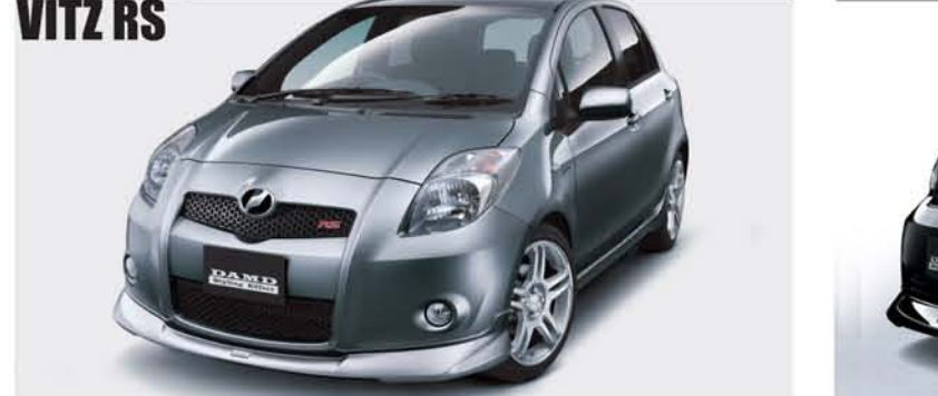
オンリーフロントハーフでスポーツヴィッツの魅力を加速