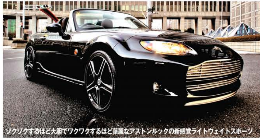
ソクソクするほど大胆でワクワクするほど華麗なアストン・レックの新感覚ライトウェイトスポーツ