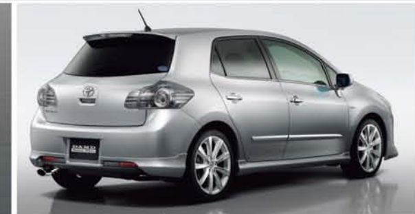
純正のイメージを格上げする後期専用 HALF プレスラインの塗装分けで一段とスポーティーに