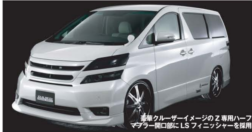
豪華クルーザーイメージのZ専用 HALFマフラー開口部にLSフィニッシャーを採用