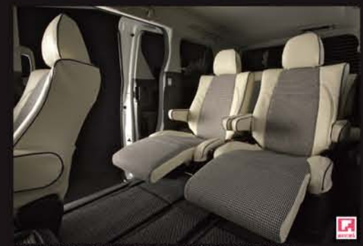
MARINE Style オフホワイト×モントーン千鳥格子 ¥130,200 (税込)