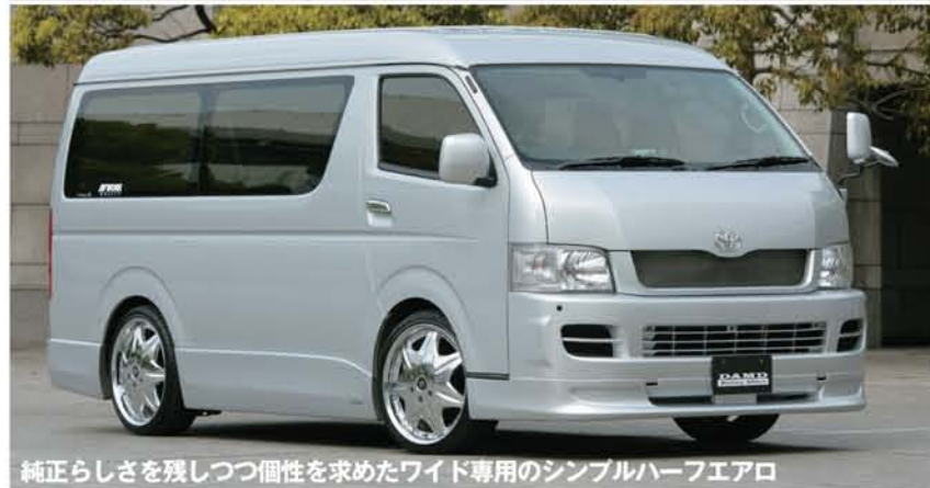
純正らしさを残しつつ個性を求めたワイド専用のシンプル HALFエアロ