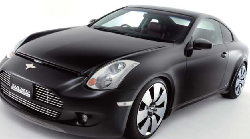
プレミアムカーへと昇華させる機能美優れたアストンフェイス