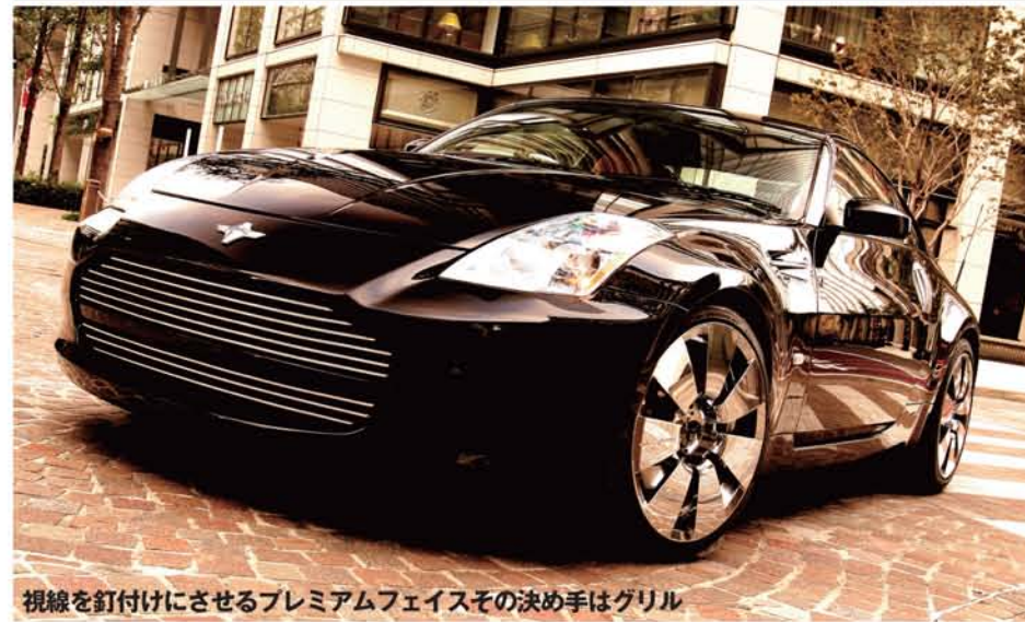
視線を釘付けにさせるプレミアムフェイスその決め手はグリル