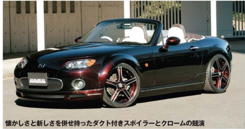
懐かしさと新しさを併せ持ったダクト付きスポイラーとクロームの競演