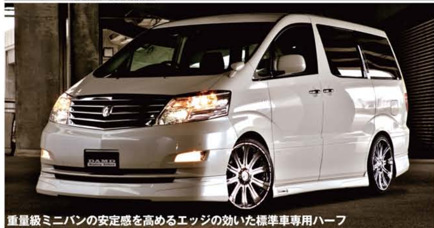
重量級ミニバンの安定感を高めるエッジの効いた標準車専用 HALF