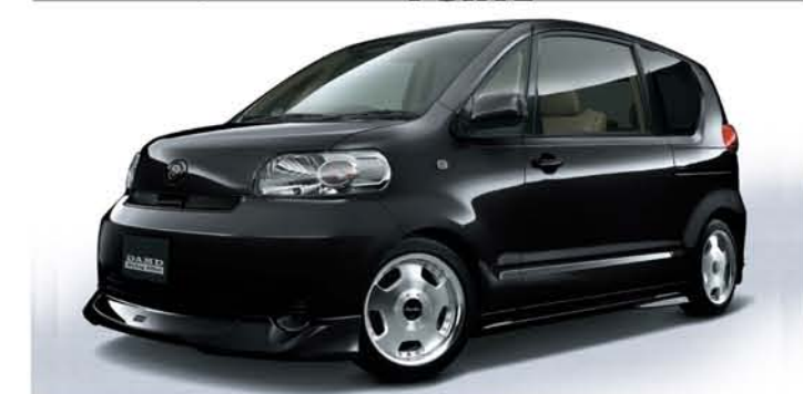
いつもと変わらぬ走りを楽しめる適度な後付け感