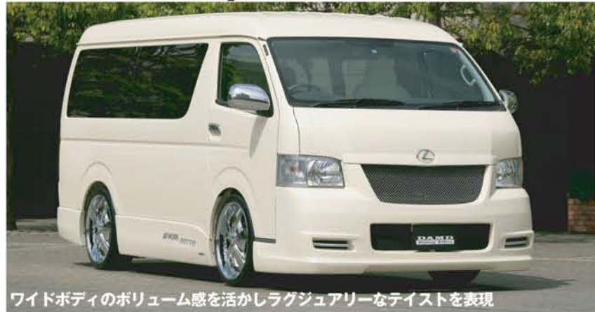
ワイドボディのボリューム感を活かしてラグジュアリーなテイストを表現