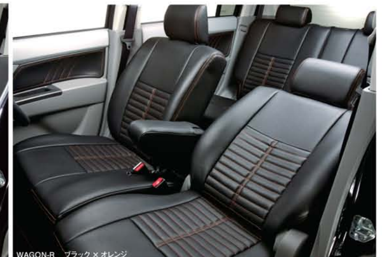
WAGON-R ブラック×オレンジ