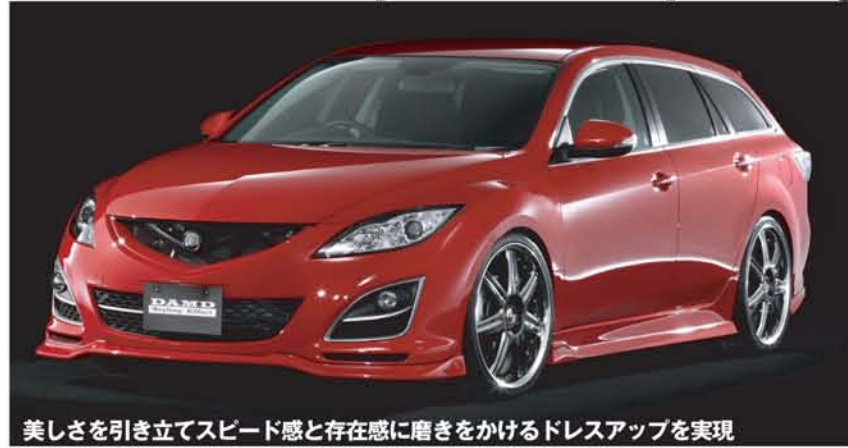
美しさを引き立てスピード感と存在感に磨きをかけるドレスアップを実現