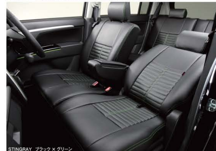
STINGRAY ブラック×グリーン