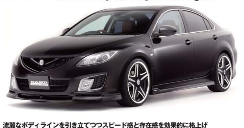
流麗なボディラインを引き立てつつスピード感と存在感を効果的に格上げ