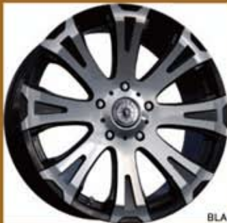
BLACK POLISH / CG IMAGE