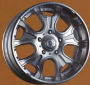
SILVER POLISH / MACHINING ※5/150 / 6/139.7のみ