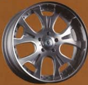
ALL MACHINING (下記価格)

高級車特有の存在感にマッチする5本スポークのワイルドなデザイン。大口径ホイールディスク部は、走行時の鈍さを感じさせないよう鍛造素材で軽量化。マシニング加工での削り出しに加え、アルミ本来の質感を表現するツールマーク(削りキズ)を活かす表面処理仕上げ、1本1本丁寧に組み付けた3ピースホイール。熟練職人の繊細な技により高精度なバランスを実現。