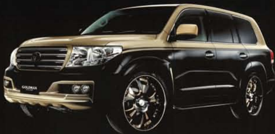
LAND CRUISER / URJ 202W