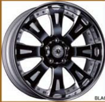
BLACK ALUMITE MACHINING