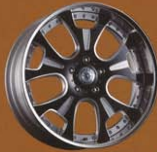
BLACK ALLUMITE MACHINING ¥8,000(¥8,400)UP