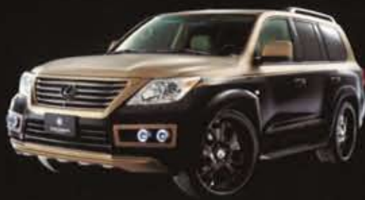
LEXUS LX570 / URJ200