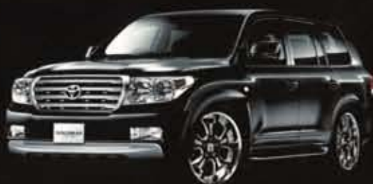
LAND CRUISER / URJ 202W