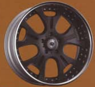
NEW! SHOT BLACK ALLUMITE (下記価格)