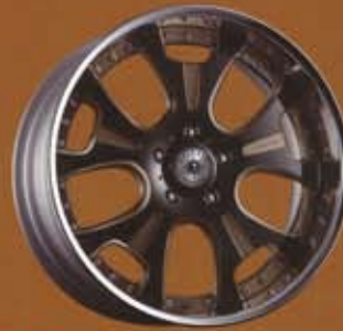
NEW! BLACK ALLUMITE MACHINING BRONZE CLEAR ¥20,000(¥21,000)UP