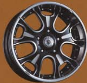
BLACK POLISH / MACHINING