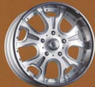
WHITE POLISH / MACHINING